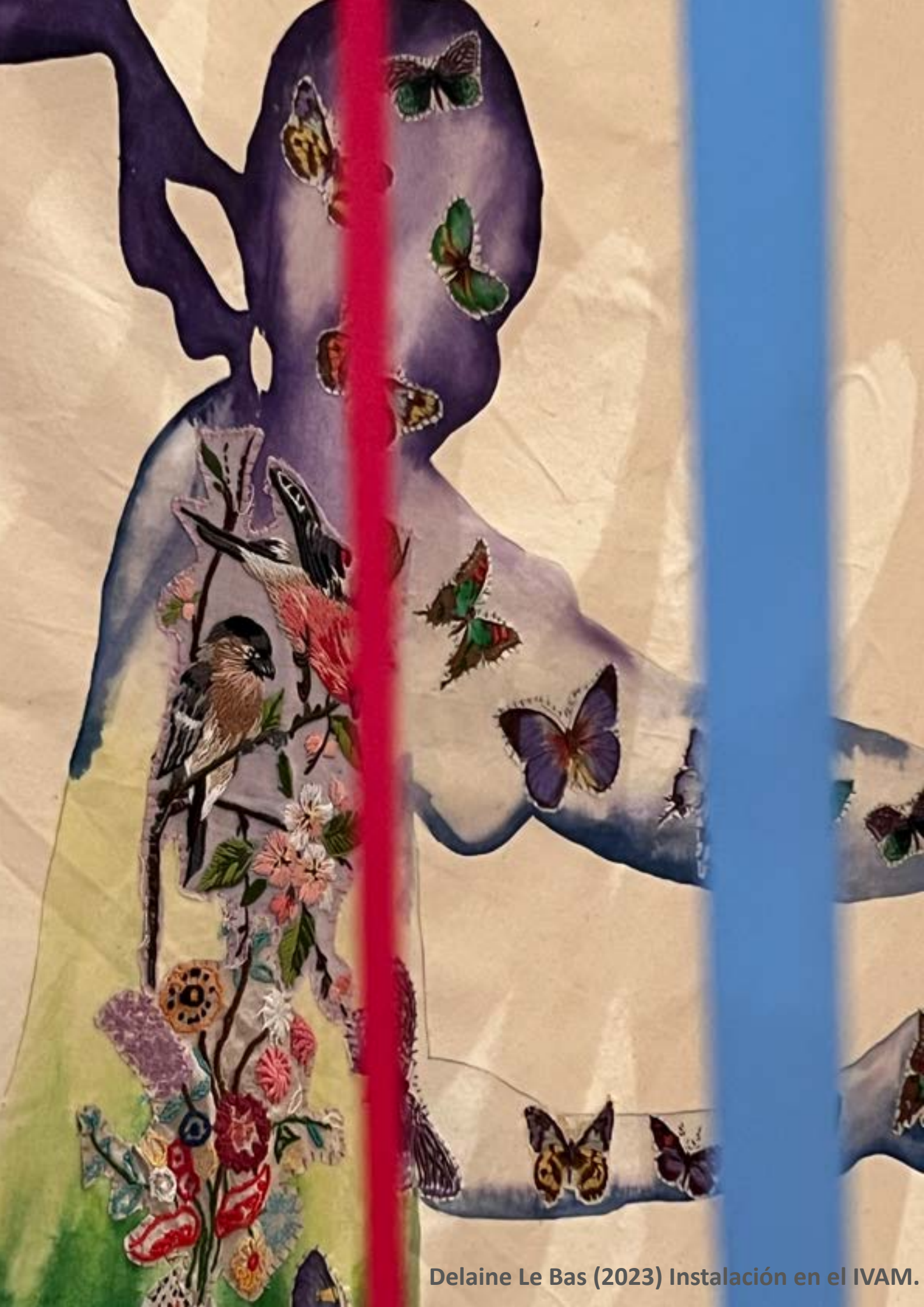
Delaine Le Bas (2023) Instalación en el IVAM.