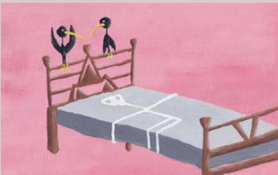
Imagen 1. Pauline Mauruschat (2023). via instagram : @_pau_mau