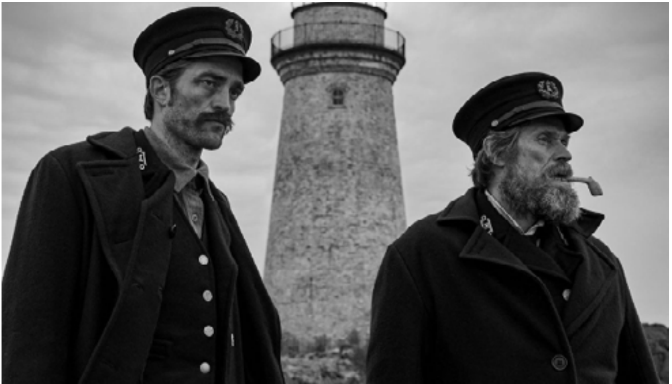
Imagen: Escena de la película "El Faro".